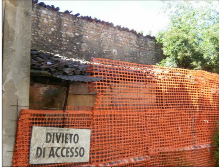
edificio D + muro a confine, verso mapp. 272 di terzi (lato ovest)