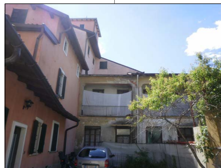
vista frontale porzione edificio A di proprietà + vista laterale edifici proprietà di terzi mapp. 272