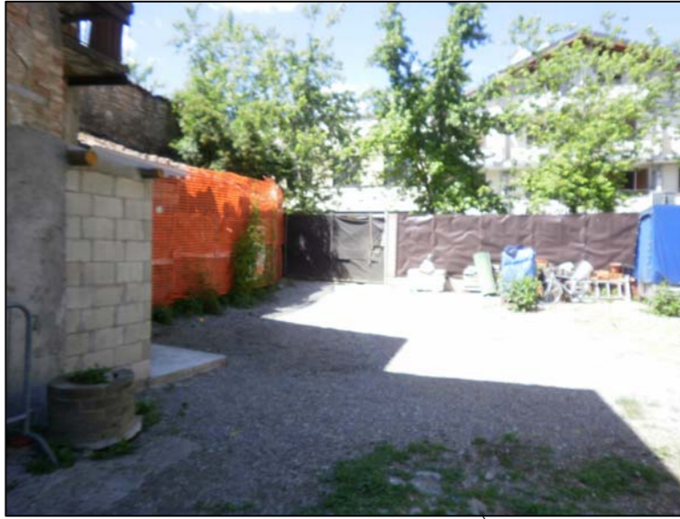
ingresso corte vista dall' interno (verso nord)