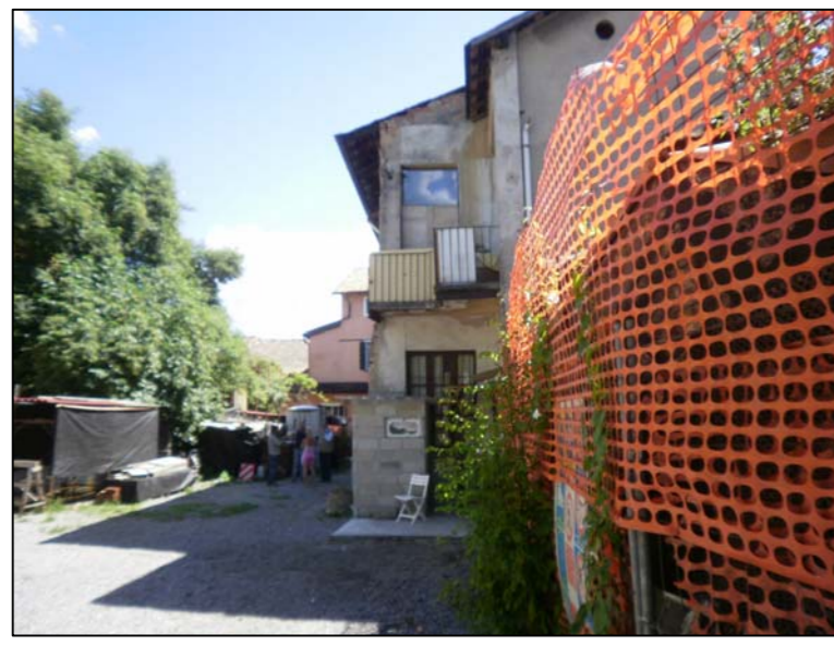
edificio interno di proprietà (lato ovest, edificio A)