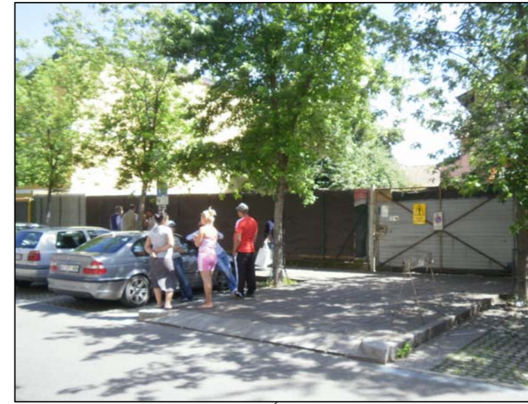
vista esterna su via Formenti (zona d'ingresso)