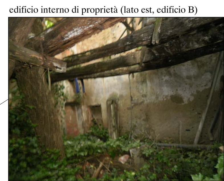
edificio interno di proprietà (lato est, edificio B)