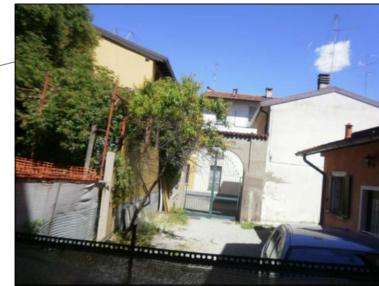
uscita su via Martino Bassi (su area non oggetto di intervento)