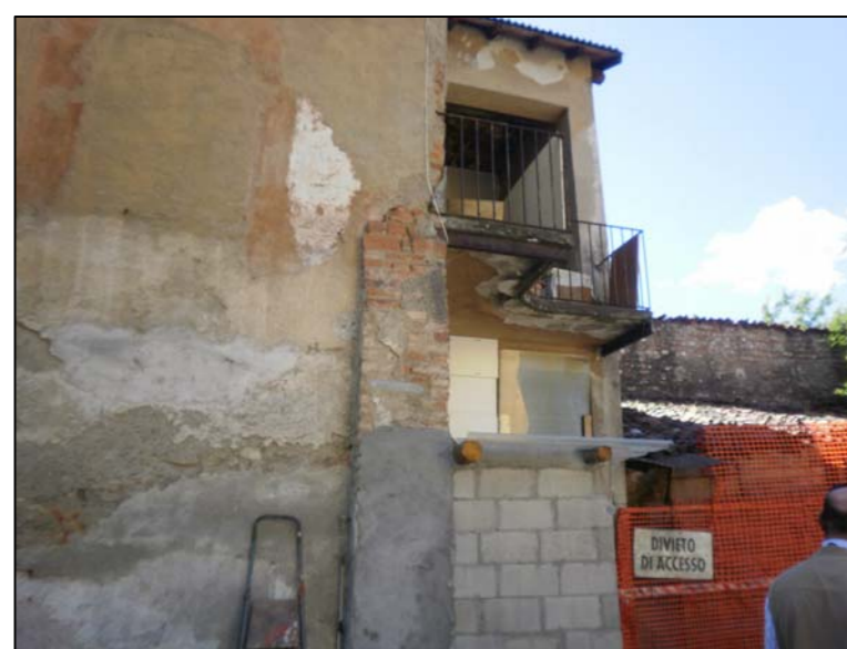
porzione edificio interno di proprietà (verso ovest, edificio A)