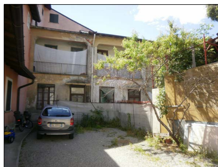
edificio interno di proprietà (verso ovest, edificio A)