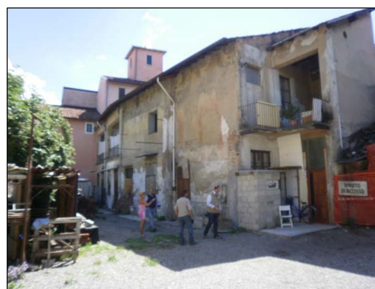
edificio interno di proprietà (verso ovest, edificio A)