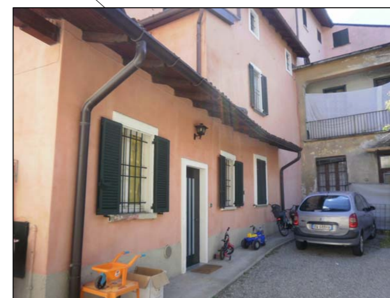
edifici proprietà di terzi (mapp. 272), lato sud