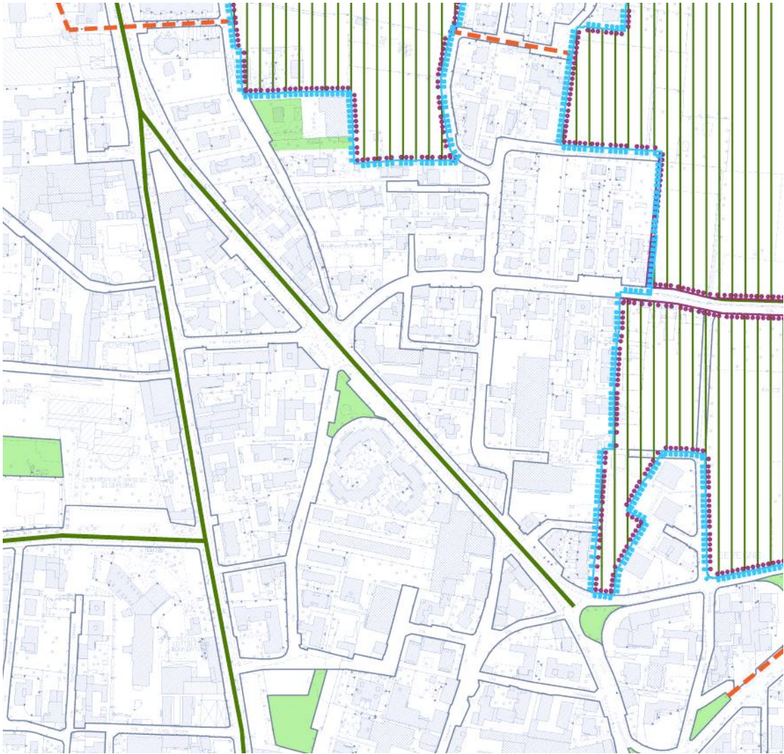
PIANO DELLE REGOLE – STRALCIO TAVOLA PR01b